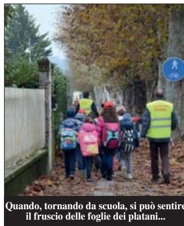
Quando, tornando da scuola, si può sentire il fruscio delle foglie dei platani...

solo camminare all'aria aperta, alleggerire il traffico intorno agli edifici scolastici, insegnare ai ragazzi a muoversi in sicurezza e autonomia per strada. Il Pedibus vuol dire anche aggregazione tra i bambini e arrivare di buon umore e pimpanti all'inizio delle lezioni. Insomma, il Pedibus è un ottimo modo per iniziare bene la giornata, anche per i nostri numerosi "autisti". Tutti iscritti al Gruppo Volontari di Sommariva Perno, con il quale il Comune ha stipulato una