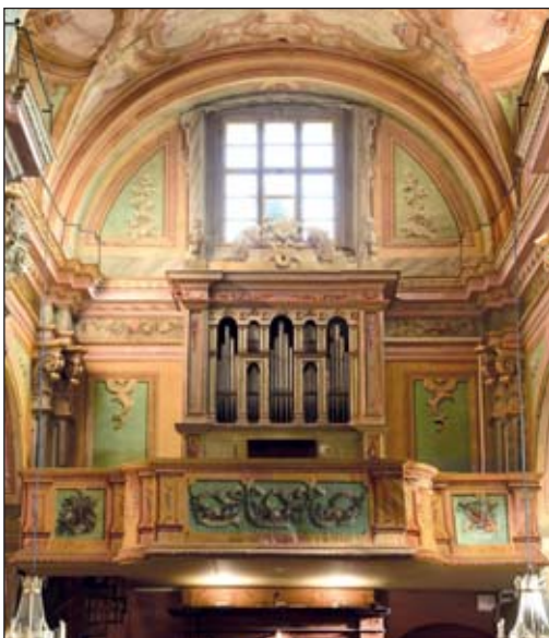
L'organo storico della Parrocchiale dello Spirito Santo, dopo i restauri

Anche l'Amministrazione comunale ha fatto la sua parte, contribuendo in modo simbolico ai restauri, onerosi, ma indispensabili e soprattutto indifferibili. Perché è vero che l'organo è della Parrocchia, ma è un tesoro ritrovato di cui tutto il paese può andare fiero, perché è un pezzo della nostra storia e della nostra identità.