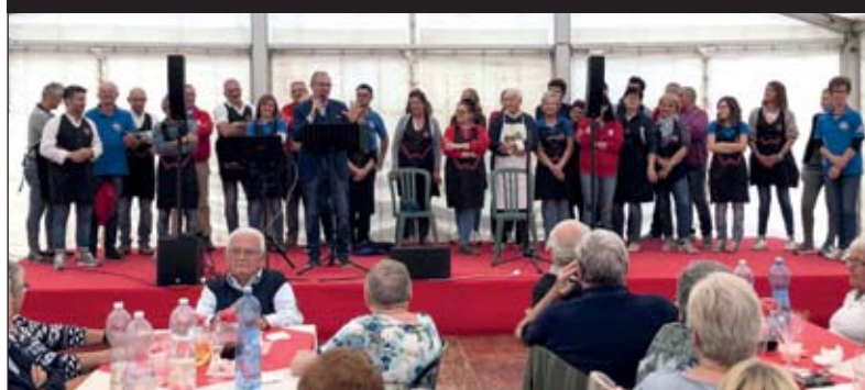
Il saluto e il “grazie” del sindaco a tutti i volontari della Pro Loco al termine della festa patronale di S. Croce

imprescindibile per un gruppo che voglia fare promozione del territorio.