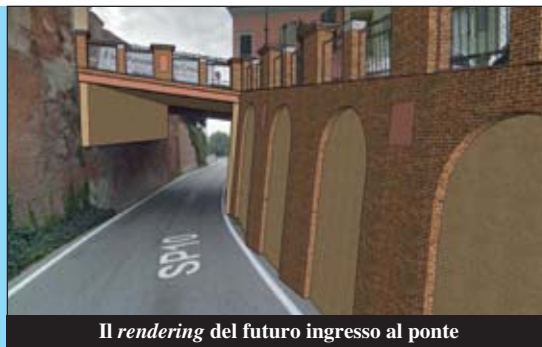
Il rendering del futuro ingresso al ponte

Stanno per avere inizio i lavori per la sistemazione dell'area intorno al ponte di piazza IV Novembre, finanziati con 30.000 euro dalla Fondazione CRC nell'ambito del "Bando Distruzione 2019", al quale il Comune ha partecipato e che si è concluso positivamente, grazie anche all'apporto di tanti cittadini che hanno votato on line l'idea progettuale. Il progetto, redatto dall'ing. Giulio Gallo, è già stato approvato dalla Commissione paesaggistica comunale. Che cosa prevede? Il muro di contenimento lungo piazza IV Novembre sarà rivestito in mattoni rossi, disposti secondo un disegno ad archi che riprende architettonicamente il terrapieno del castello della Bela Rosin. Allo stesso modo, coerentemente con gli edifici storici del paese, sarà ricoperta anche la soletta del ponte. Il parapetto di quest'ultimo e quello della piazza, invece, riprenderanno lo stile della balaustra del giardino del castello,