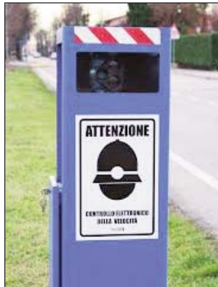
Il box che ospiterà l'autovelox

Sono in arrivo sulle strade provinciali che attraversano il territorio comunale cinque autovelox. Li hanno richiesti e li richiedono con insistenza molti cittadini e l'Amministrazione comunale si è subito attivata, anche per dare esecuzione a uno dei punti del suo programma, quello della sicurezza stradale. A questo scopo è stato firmato un protocollo d'intesa tra il Comune di Sommariva Perno e la Provincia, proprietaria e responsabile delle strade che attraversano il nostro paese. Saranno quindi installati a breve cinque armadi dissuasori (tecnicamente si chiamano così...) progettati per ospitare l'autovelox.