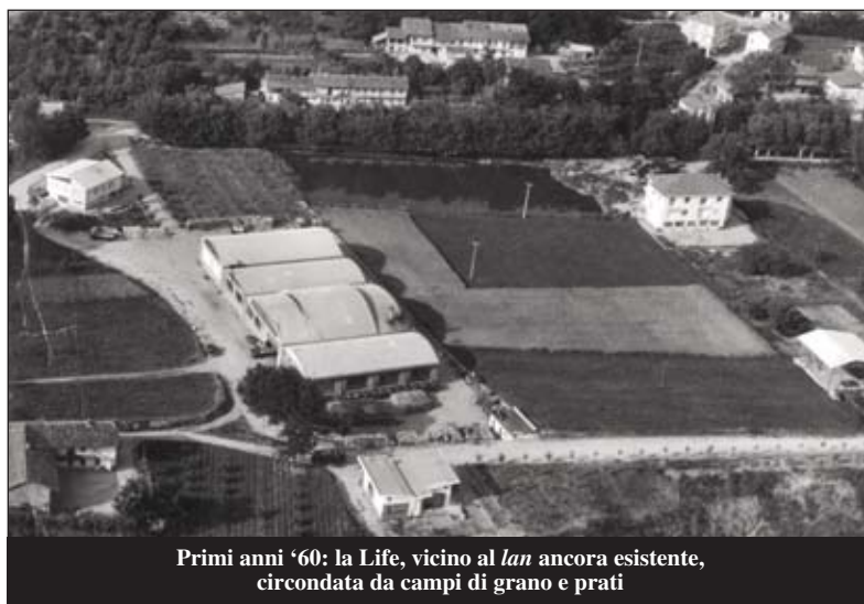
Primi anni '60: la Life, vicino al lan ancora esistente, circondata da campi di grano e prati