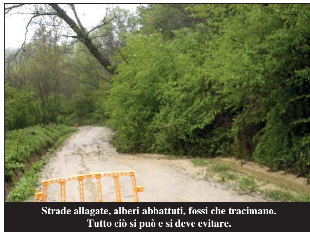
Strade allagate, alberi abbattuti, fossi che tracimano. Tutto ciò si può e si deve evitare.

- che il Comune potrà eseguire d'ufficio dette opere, con rivalsa di tutte le spese sostenute ed oneri relativi a carico degli obbligati, a norma dell'art. 70, comma 2, del Regolamento di esecuzione del Codice della Strada (D.P.R. n. 495 del 16.12.1992 e successive modifiche ed integrazioni) o dei vigenti