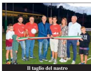
Il taglio del nastro