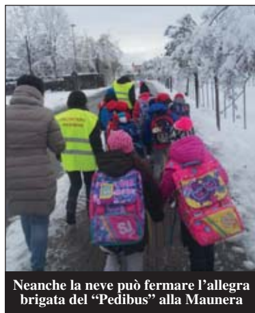
Neanche la neve può fermare l'allegria brigata del "Pedibus" alla Maunera

Il Pedibus a Sommariva Perno è partito... con il piede giusto! Tutti in fila, qualcuno tenendosi per mano, gli occhi puntati sulla strada, ma anche sulle foglie che cadono, sulla neve che si scioglie, sulle gocce che scendono e le orecchie sempre bene aperte per ascoltare le indicazioni degli accompagnatori. Sono 36 i bambini della Primaria che hanno aderito finora al progetto Pedibus, fortemente voluto dall'Amministrazione comunale. E il numero dei piccoli partecipanti indica che questa è stata una scelta vincente, tanto da decidere di aprire subito ben due linee di Pedibus: un percorso che parte da piazza Torino e viaggia lungo il viale, l'altro che percorre la via Maunera. Entrambi, segnalati con cartelli e indicazioni degli orari, ovviamente si ricongiungono, sempre puntuali, sempre allegri dinanzi alla scuola. Perché l'idea del Pedibus non è