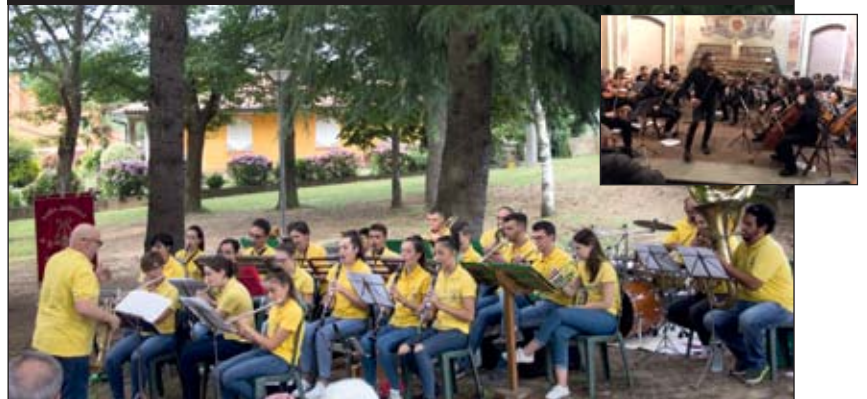
Un momento del “Concerto d'estate” della banda musicale del Roero. Nel riquadro: l'Orchestra Gli Armonici di Bra ne “Le Quattro Stagioni”

Comune e con altre Associazioni con cui da tempo collabora, un “pacchetto” di iniziative di altissimo livello, di cui parleremo nel