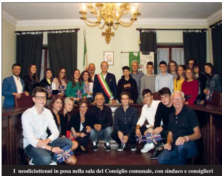
I neodiciottenni in posa nella sala del Consiglio comunale, con sindaco e consiglieri