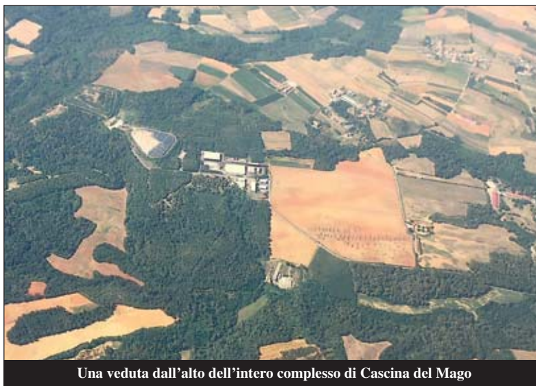
Una veduta dall'alto dell'intero complesso di Cascina del Mago

Ebbene, ora il Comune regolerà mediante convenzione i rapporti con Roero Verde per l'attività e gli eventi da svolgersi nel parco per i prossimi anni,