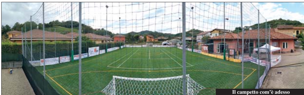
Il campetto com’è adesso

Domenica 8 settembre, in occasione della “Soccer Cup 2019”, evento organizzato dall’Acli di Valle Rossi proprio per l’occasione, è stato inaugurato il nuovo campo sintetico.