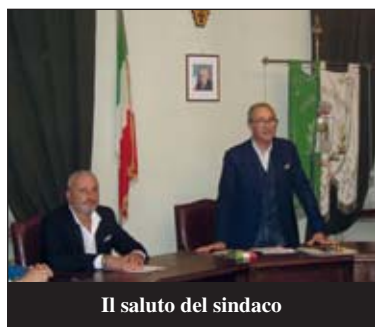
Il saluto del sindaco

Calato nella realtà, questo invito significa per i ragazzi assunzione di responsabilità per se stessi e per il paese; partecipazione attiva all'interno della comunità, nelle tante associazioni di volontariato che già animano la vita di Som-