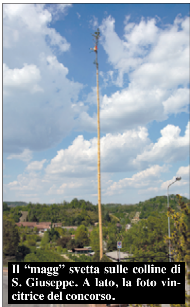
Il "magg" svetta sulle colline di S. Giuseppe. A lato, la foto vincitrice del concorso.