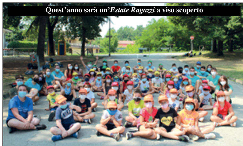
Quest'anno sarà un'Estate Ragazzi a viso scoperto

del capoluogo, il parco forestale, la piscina esterna del CSR, il campo sportivo ed altri begli angoli del paese diventeranno luoghi di incontro, di svago, di compiti delle vacanze. Coinvolti quasi 100 tra bambini e ragazzi dalla prima elementare alla terza media, oltre a decine di "ragazzi grandi" (adolescenti fino ai 18 anni) che aiuteranno nella animazione gli educatori professionali della cooperativa "Lunetica" di Bra, cui il Gruppo Volontari ha affidato l'organizzazione di "Estate Ragazzi". Cinque settimane, dunque. Saranno possibili e più ricche di proposte grazie ad un generoso contributo di € 7.000 della Fondazione CRC, che ha apprezzato il progetto presentato dal Gruppo Volontari.