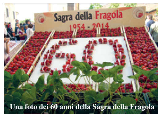
Una foto dei 60 anni della Sagra della Fragola

2020 a causa del Covid) ha sempre voluto e vuole rendere onore a quei pionieri che seppero "inventare" un futuro, dando speranza e portando ricchezza alle nostre colline fino ad allora aride e povere. Lo fa anche nel 2022, dopo due anni di grandi tribolazioni e chiusure, nei quali però "il posto delle fragole" in piazza Europa è stato comunque segno di speranza e di ripresa. Lo fa non per uno sterile amarcord, ma per continuare a far rivivere l'entusiasmo e la voglia di nuovo che animarono i "pionieri" e che possono essere lo stimolo, coniugato al presente, per un futuro ancora possibile per tanti giovani e tante famiglie.