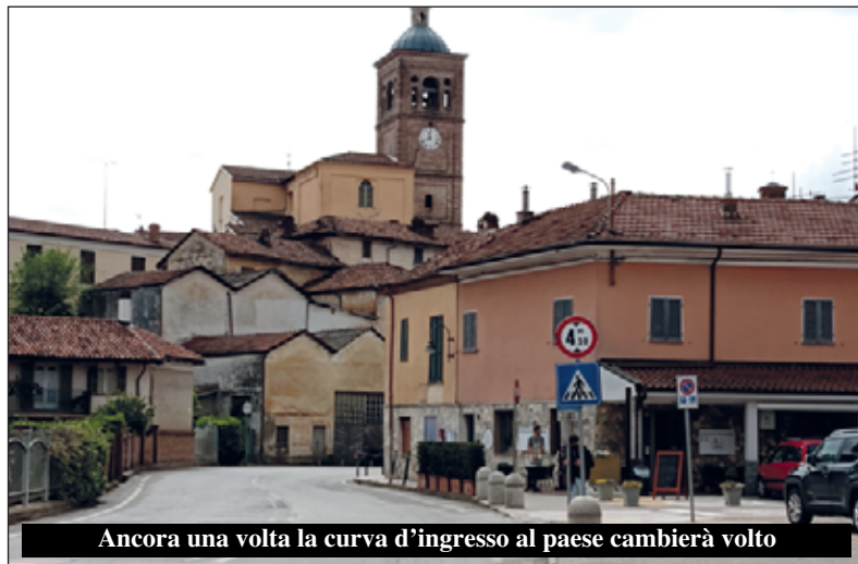
Ancora una volta la curva d'ingresso al paese cambierà volto

L'altro intervento finanziato dalla Legge di Bilancio 2019, relativo alla messa in sicurezza del Rio Mellea, è stato affidato alla ditta Nuova Idro srl che ha offerto un ribasso pari al 14,95% sull'importo a base d'asta.