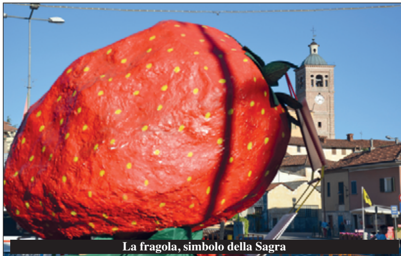
La fragola, simbolo della Sagra