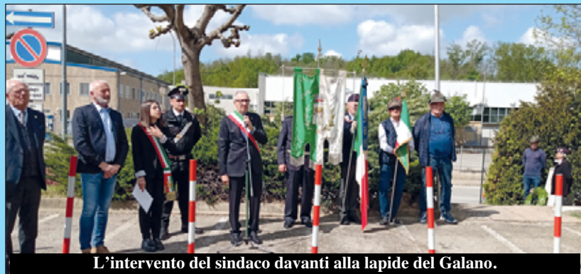
L'intervento del sindaco davanti alla lapide del Galano.