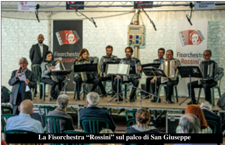
La Fisorchestra "Rossini" sul palco di San Giuseppe