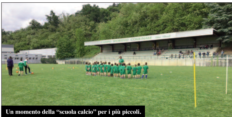
Un momento della "scuola calcio" per i più piccoli.