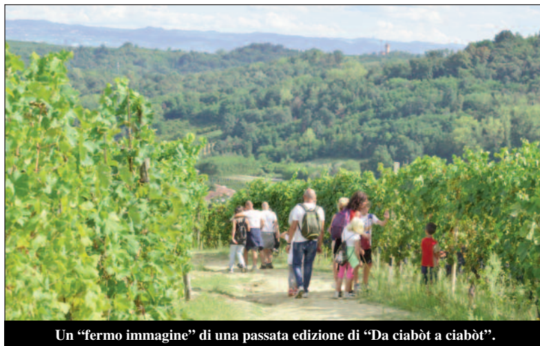
Un "fermo immagine" di una passata edizione di "Da ciabòt a ciabòt".