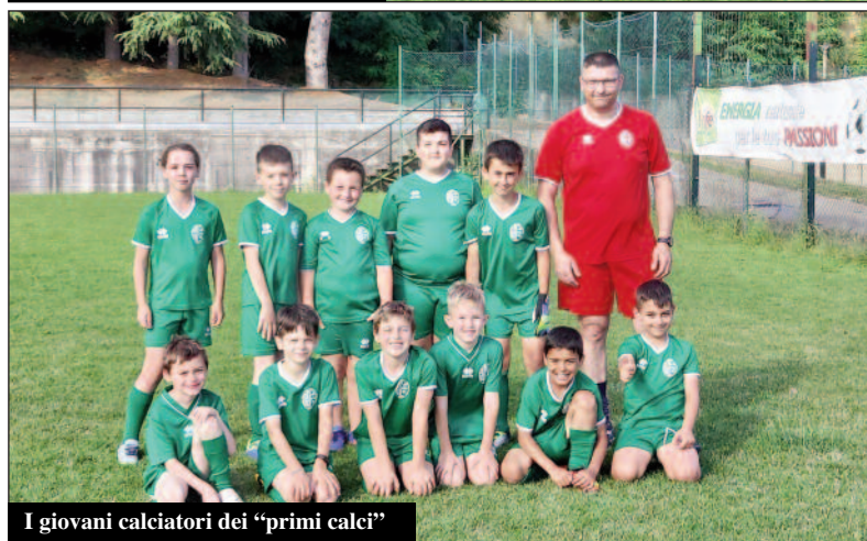
I giovani calciatori dei "primi calci"