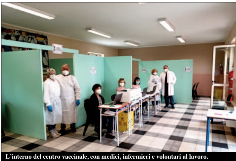
L'interno del centro vaccinale, con medici, infermieri e volontari al lavoro.