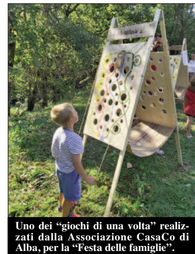
Uno dei "giochi di una volta" realizzati dalla Associazione CasaCo di Alba, per la "Festa delle famiglie".