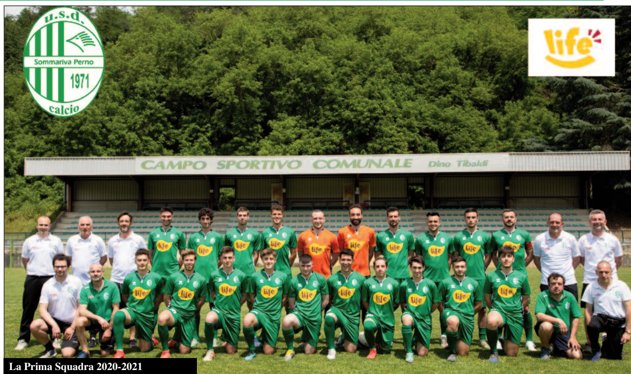
La Prima Squadra 2020-2021

Una nuova stagione sportiva ha preso il via. Ad onor del vero, quasi non ci siamo accorti che si è trattato di un nuovo inizio, in quanto quest'anno il canonico periodo di stop estivo è stato molto limitato. Infatti, abbiamo cercato di prolungare il più possibile la stagione 2020-2021, per dare ai ragazzi l'opportunità di recuperare il tempo perso a causa del Covid. Con grande entusiasmo e senso di responsabilità nei confronti dei nostri tesserati e delle loro famiglie, ben consci delle positive ricadute sociali che le nostre attività hanno sui giovani del nostro territorio, siamo dunque ai nastri di partenza di una stagione che ci auguriamo vivamente che possa essere portata a termine regolarmente. La motivazione che ci spinge a continuare con rinnovato vigore è sicuramente dettata dal fatto che in periodo di pandemia la società non solo è riuscita a mantenere in vita le proprie attività, ma addirittura ha visto incrementare esponenzialmente il numero degli iscritti. Questo ci riempie di orgoglio ed è anche un segnale che la strada intrapresa in queste ultime stagioni sia quella giusta. La più grande soddisfazione, infatti, è aver accolto ben 30 nuovi tesserati solo nelle leve più piccole della scuola calcio (annate 2014-2015-2016):