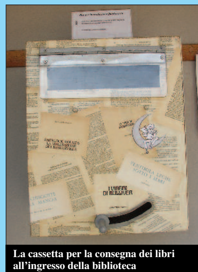
La cassetta per la consegna dei libri all'ingresso della biblioteca

Quindi, anche se lo scopo è sempre l'amore per la lettura, occhio alla cassetta giusta!