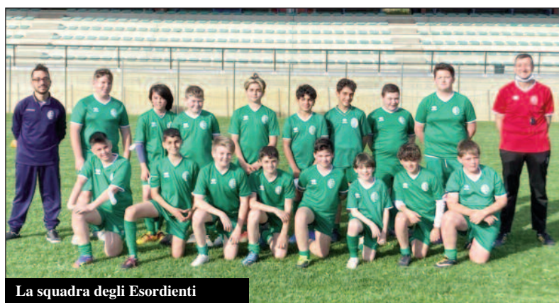
La squadra degli Esordienti