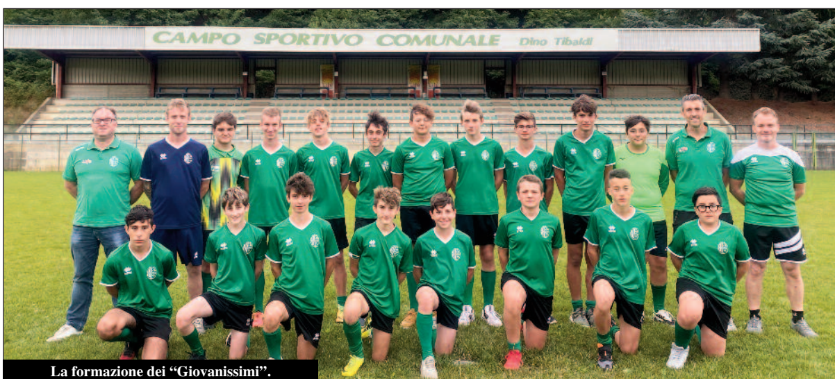
La formazione dei "Giovanissimi".