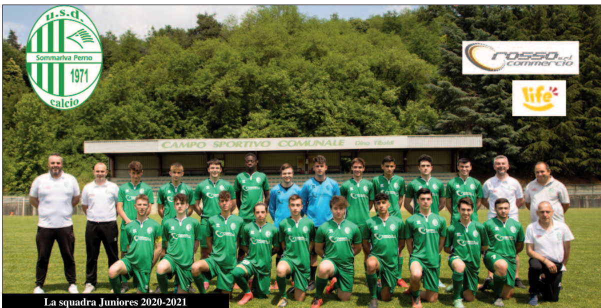
La squadra Juniores 2020-2021