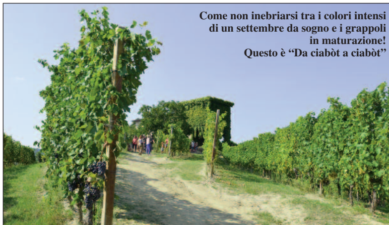
Come non inebriarsi tra i colori intensi di un settembre da sogno e i grappoli in maturazione! Questo è "Da ciabòt a ciabòt"