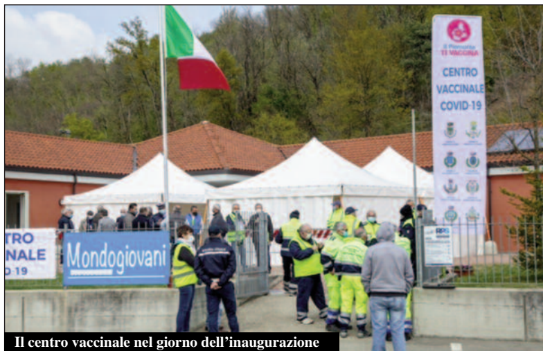
Il centro vaccinale nel giorno dell'inaugurazione