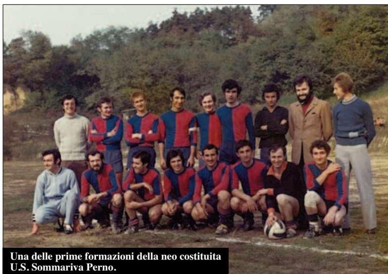
Una delle prime formazioni della neo costituita U.S. Sommariva Perno.