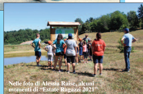
alcuni momenti di “Estate Ragazzi 2021”