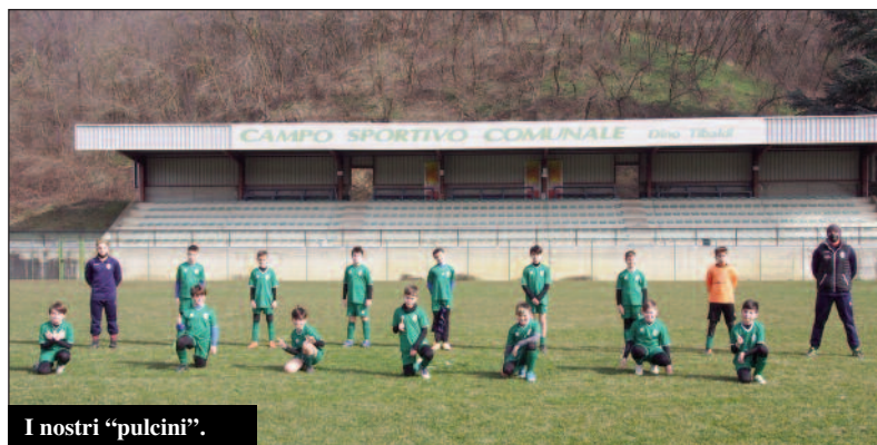
I nostri "pulcini".