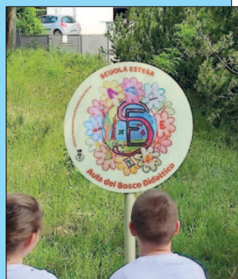
L'aula del Bosco Didattico