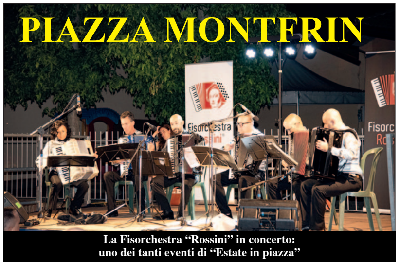
La Fisorchestra "Rossini" in concerto: uno dei tanti eventi di "Estate in piazza"

Quasi 1100 presenti ai vari eventi della prima parte della rassegna "Musica e teatro nel paese della Bela Rosin 2023". Tanti, anche provenienti da paesi e città vicine. Segno che le iniziative organizzate da Centro culturale San Bernardino, Pro Loco, Acli di San Giuseppe e di Valle Rossi, Roero Verde, in collaborazione con il Comune, hanno incontrato il gradimento del pubblico, sempre numeroso.