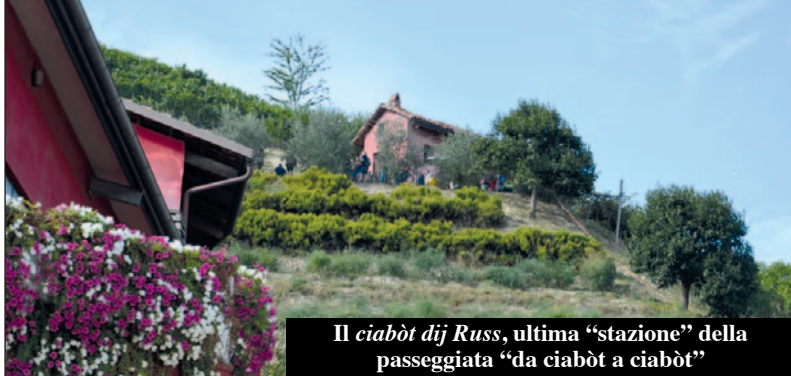
Il ciabòt dij Russ , ultima "stazione" della passeggiata "da ciabòt a ciabòt"

Nemmeno il tempo di respirare ed è... Santa Croce. La Pro Loco, reduce da una edizione perfettamente riuscita e molto apprezzata di "Da ciabòt a ciabòt" (800 visitatori hanno potuto godere della dolcezza delle nostre colline e della bontà di un menù straordinario), si è messa subito al lavoro per organizzare in pochissimi giorni gli eventi della Festa patronale 2023.