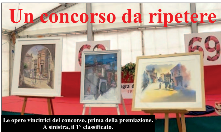
Le opere vincitrici del concorso, prima della premiazione. A sinistra, il 1° classificato.

Domenica 28 maggio, sotto il Palatenda di piazza Europa, è avvenuta la premiazione del 1° concorso di pittura estemporanea "Sagra della Fragola", che ha chiuso i tanti eventi nel calendario della 69ª Sagra. Il concorso ha visto la partecipazione di oltre 20 artisti provenienti da tutto il Piemonte, che, domenica 21 maggio, si sono sparsi per le vie e piazze del paese o sotto i portici intorno a piazza Europa per dipingere luoghi, volti, emozioni da vivere nel "paese della bela Rosin" in festa. Venerdì 26, sabato 27 e domenica 28 maggio le opere sono state esposte poi in una mostra allestita nella chiesa di San Bernardino, dove i visitatori hanno potuto indicare l'opera preferita per assegnare il "premio speciale" del pubblico. La proposta è molto piaciuta,