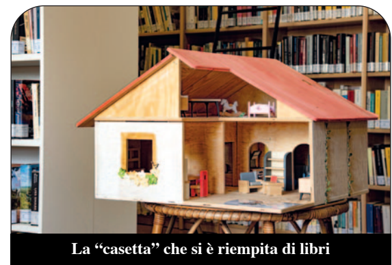
La "casetta" che si è riempita di libri

Il libro come oggetto familiare che fa parte della quotidianità: questo lo scopo della nostra proposta e