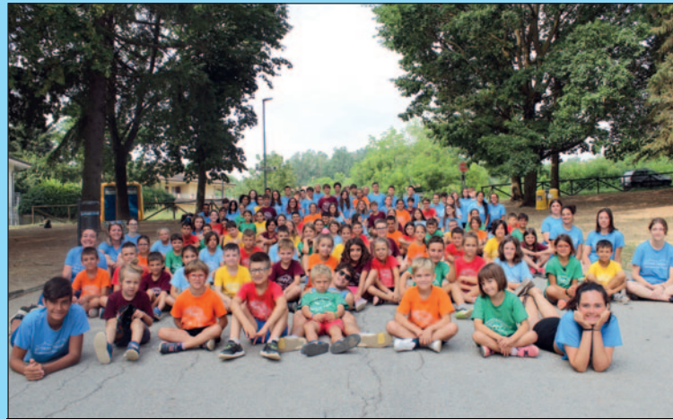
Alcuni momenti di "Estate Ragazzi 2023"