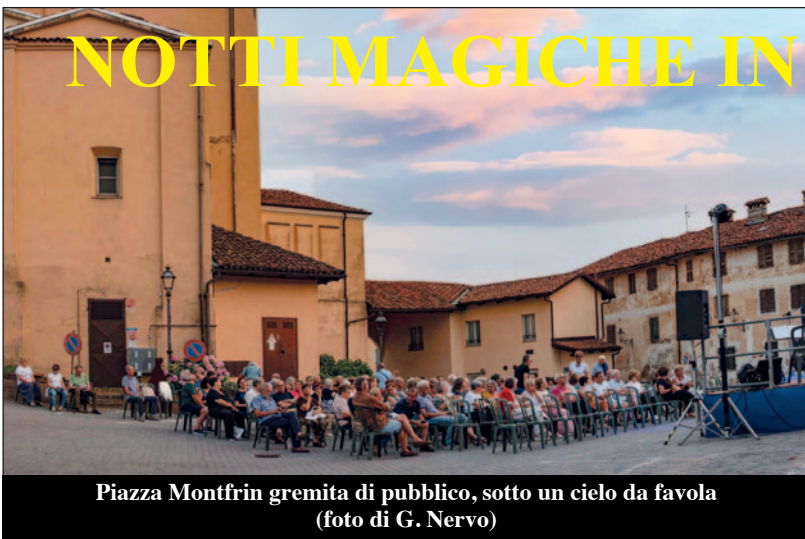
Piazza Montfrin gremita di pubblico, sotto un cielo da favola