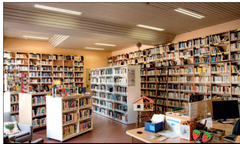
La "casa dei libri" al centro della bella sala della biblioteca