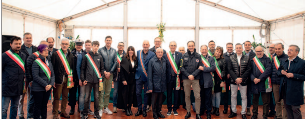
Tutte le autorità presenti all'inaugurazione de "Il posto delle fragole, in alto dopo il taglio del nastro"