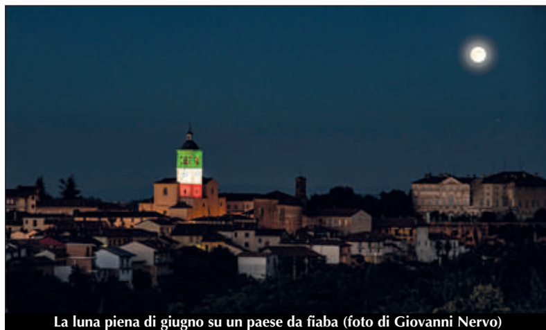
La luna piena di giugno su un paese da fiaba

I sommarivesi si sono comportati in modo esemplare, mettendo in pratica tutte le indicazioni pervenute dal governo, e quindi i casi di Covid 19 non sono aumentati all'interno del paese, ma si sono fermati a quelli che purtroppo sono stati contagiati fuori paese. Ora invito tutti a non abbassare la guardia poiché dopo le vacanze comincia una fase molto complessa e con l'inizio delle scuole (spe-