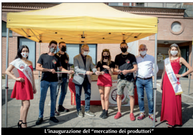
L'inaugurazione del “mercato dei produttori”