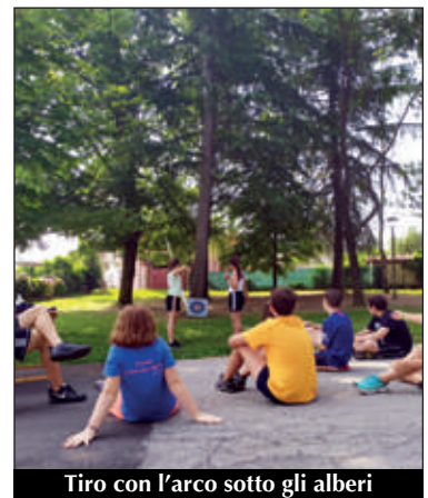
Tiro con l'arco sotto gli alberi