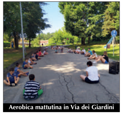
Aerobica mattutina in Via dei Giardini