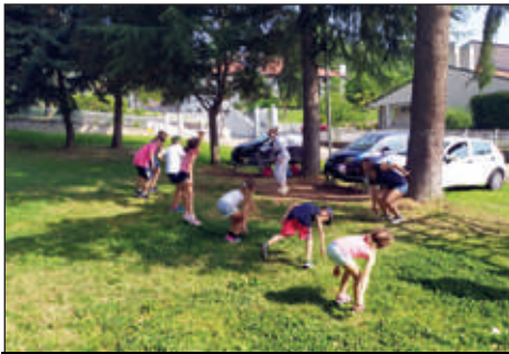
Anche il judo si sono inventati...