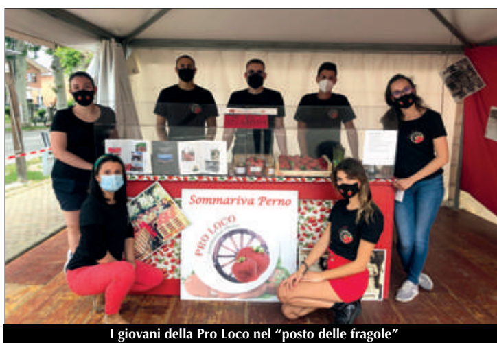
I giovani della Pro Loco nel “posto delle fragole”