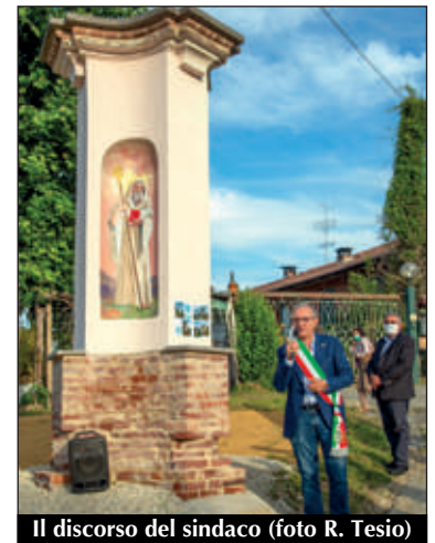
Il discorso del sindaco