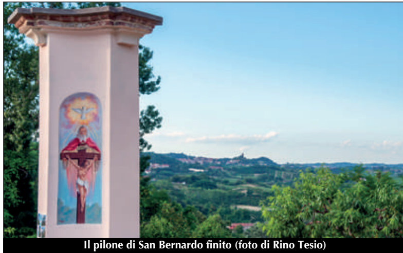
Il pilone di San Bernardo finito