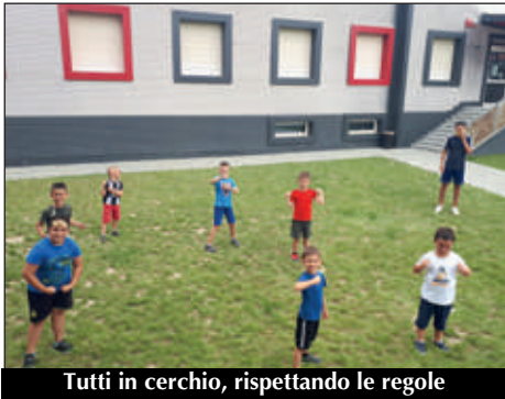
Tutti in cerchio, rispettando le regole