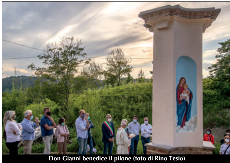
Don Gianni benedice il pilone