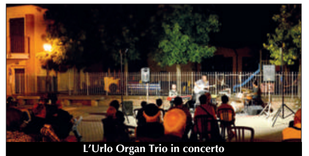
L'Urlo Organ Trio in concerto

Domenica 30 agosto Gli Archimedi, gruppo di alto livello, avrebbero dovuto chiudere in bellezza le manifestazioni di "Estate... in centro 2020" con un grande concerto di Musica d'autore sotto le stelle , eseguendo brani di grandi autori classici e contemporanei. Purtroppo pioggia e freddo non lo hanno permesso. Il concerto è però solo rinviato: si terrà infatti domenica 4 ottobre , nel pomeriggio: sarà un modo per salutare con note di gioia un'estate di difficoltà e rimpianti.