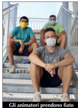
Gli animatori prendono fiato