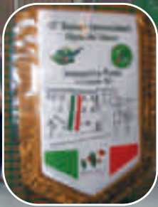
Il gagliardetto del Raduno 2011