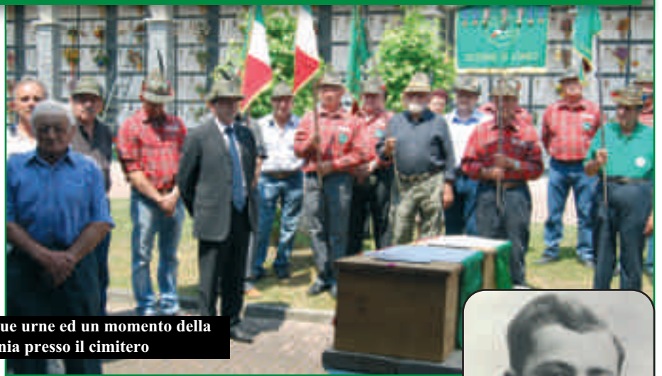
L'arrivo delle due urne ed un momento della cerimonia presso il cimitero