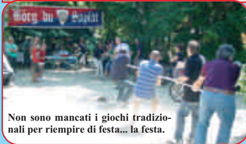
Non sono mancati i giochi tradizionali per riempire di festa... la festa.

Feste sull'aia, come una volta. E quando manca l'aia, provvede l'ombra fresca dei castagni al Tiro al piattello. Due borgate, due incontri nella semplicità e nell'allegria. Ha cominciato il comitato di QUELLI DEL CENSIMENTO (il