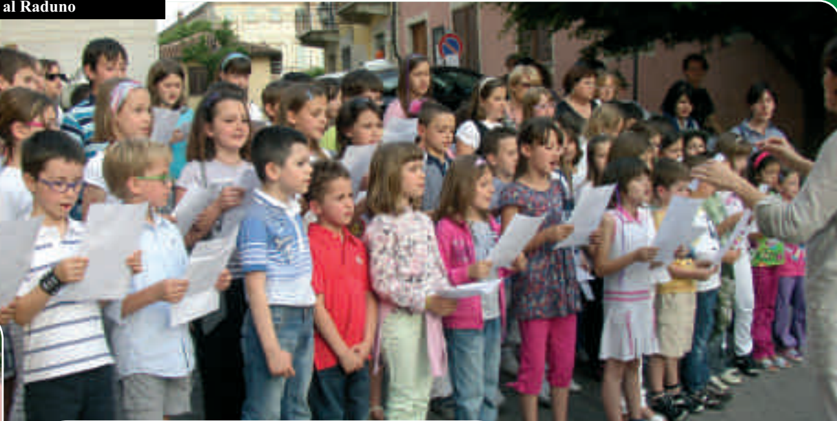
Il coro dei bimbi che salutano il Tricolore