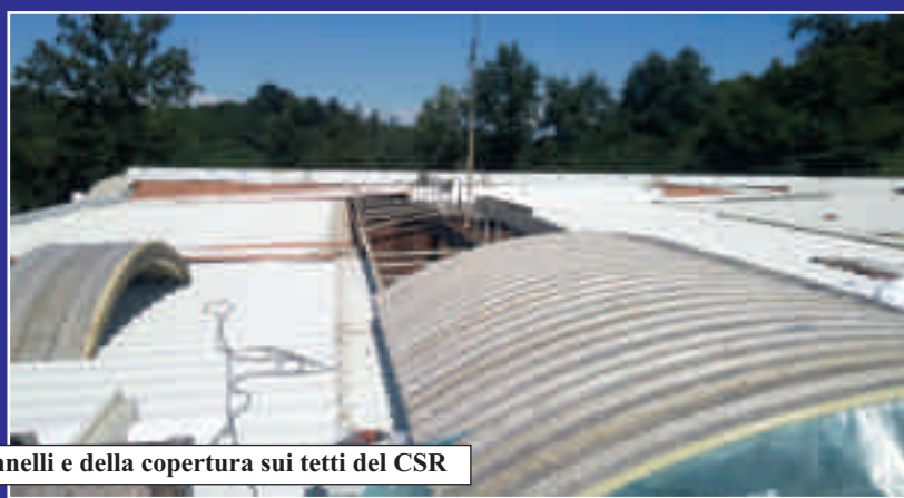
Particolari dei pannelli e della copertura sui tetti del CSR