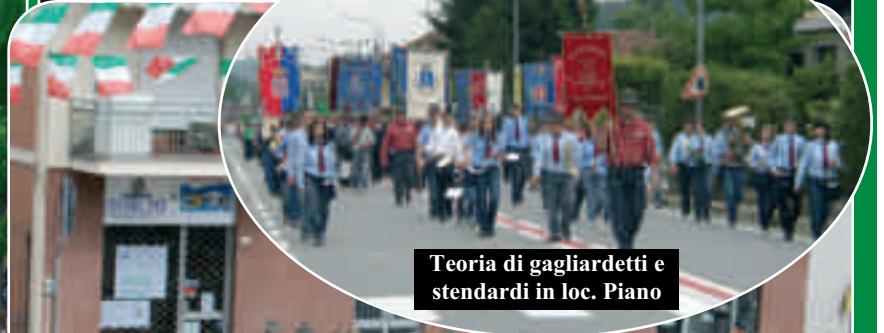
Teoria di gagliardetti e stendardi in loc. Piano