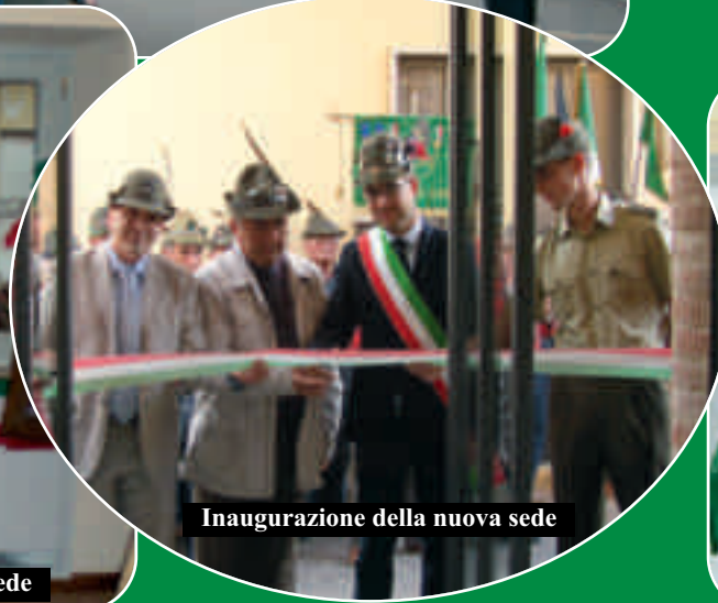
Inaugurazione della nuova sede