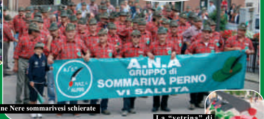
Le Penne Nere sommarivesi schierate