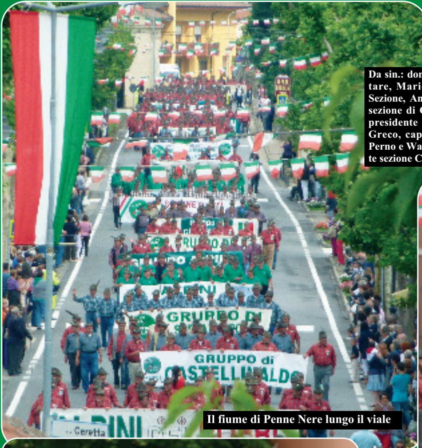
Il fiume di Penne Nere lungo il viale