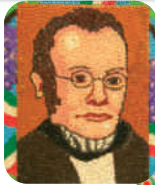
Volti notissimi che hanno fatto l'Italia