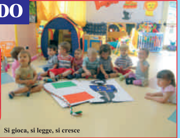
Si gioca, si legge, si cresce

E' trascorso un altro anno al nostro micronido "Fragolino" e, con grande soddisfazione, i sorrisi dei bimbi si sono moltiplicati. A piccoli passi, con impegno e pazienza, si intraprendono percorsi che portano ad importanti traguardi.