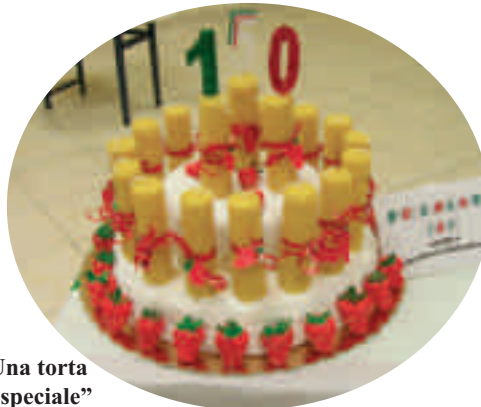
Una torta "speciale"