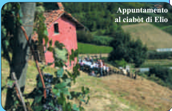
Appuntamento al ciabòt di Elio

ore 17,00 - GRAN POLENTATA per finire tutti insieme in allegria.