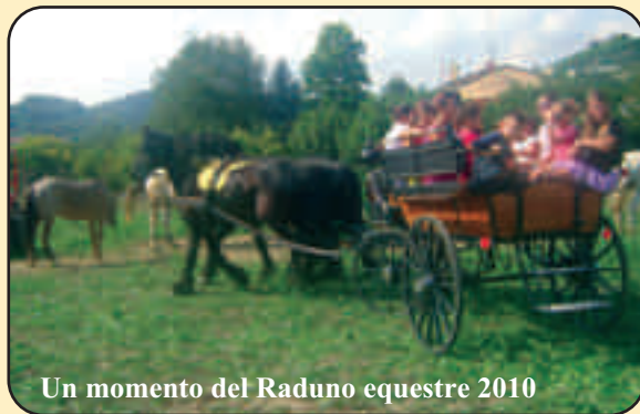
Un momento del Raduno equestre 2010