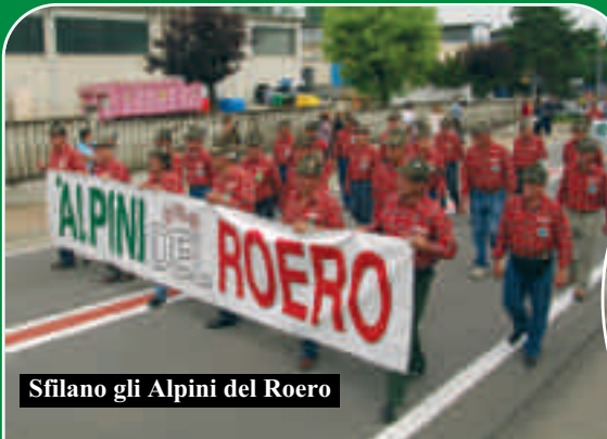
Sfilano gli Alpini del Roero