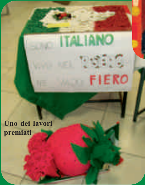
Uno dei lavori premiati