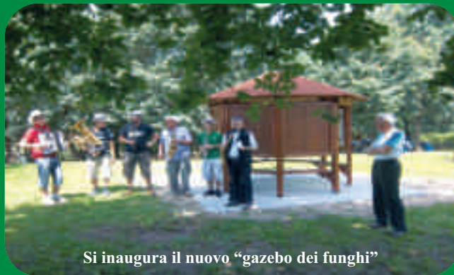
Si inaugura il nuovo "gazebo dei funghi"

Domenica di festa con il trenino per circumnavigare il parco, l'esercitazione degli Aib, i volontari antincendio boschivo, che hanno inscenato una esercitazione, tra gli occhi stupiti degli ospiti.