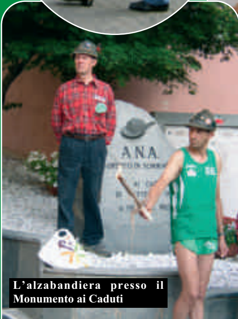
L’alzabandiera presso il Monumento ai Caduti