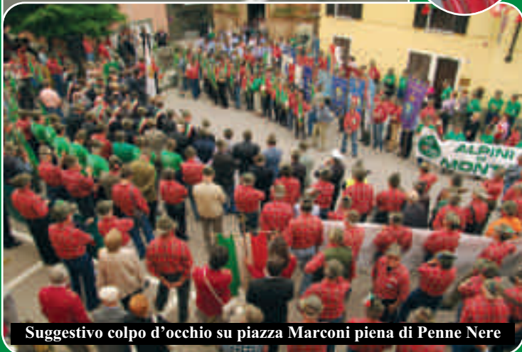
Suggestivo colpo d'occhio su piazza Marconi piena di Penne Nere