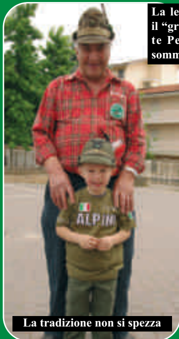
La tradizione non si spezza