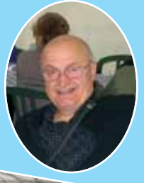
Concorso "Balconi fioriti"