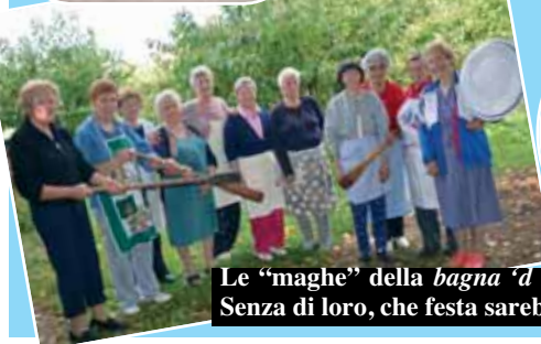
Le "maghe" della bagna 'd sautisa e i mitici pulentau. Senza di loro, che festa sarebbe?