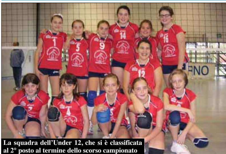
La squadra dell'Under 12, che si è classificata al 2° posto al termine dello scorso campionato

Novità nella pallavolo sommarivese. A luglio è stata costituita infatti l'ASD VOLLEY ROERO. La nuova associazione sportiva, nata dall'unione di diverse realtà del territorio quali Volley Sommariva Perno, Canale Volley, GSV Corneliano Volley, GS Vezza Volley e Monticello Volley, si pone come obiettivo quello di essere un unico soggetto di riferimento per il Roero nel dare l'opportunità alle ragazze e alle bambine di cimentarsi in uno sport che permette loro di vivere un'esperienza come quella di "fare squadra" a volte vincendo, a volte perdendo, ma sempre divertendosi. Al centro del progetto c'è "l'individuo", perché la pallavolo è un modo per conoscere se stessi, i propri limiti