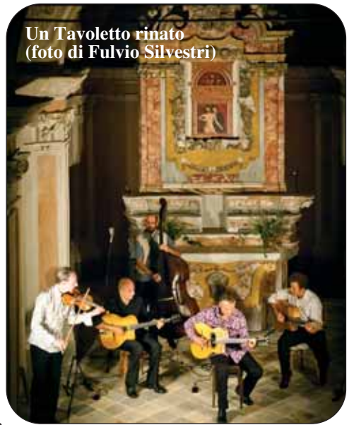
Un Tavoletto rinato