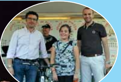
Premiazione al termine di Spot in piazza