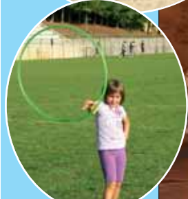
La magia di cerchio e pattini