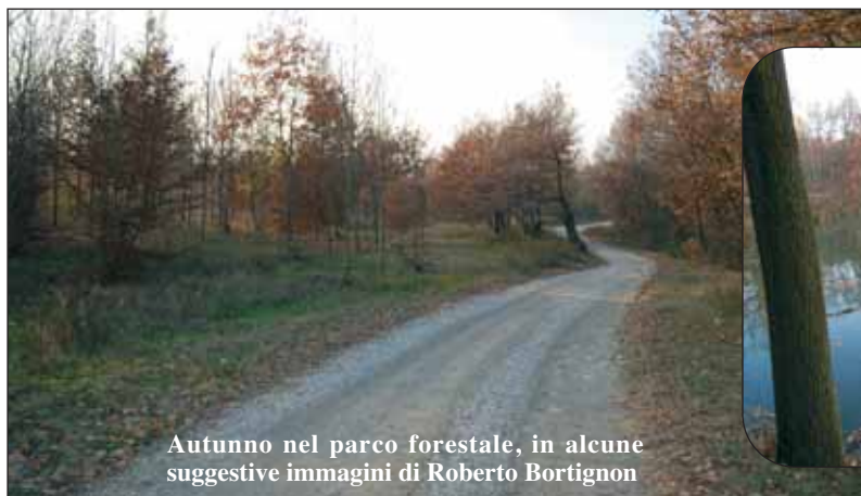
Autunno nel parco forestale, in alcune suggestive immagini