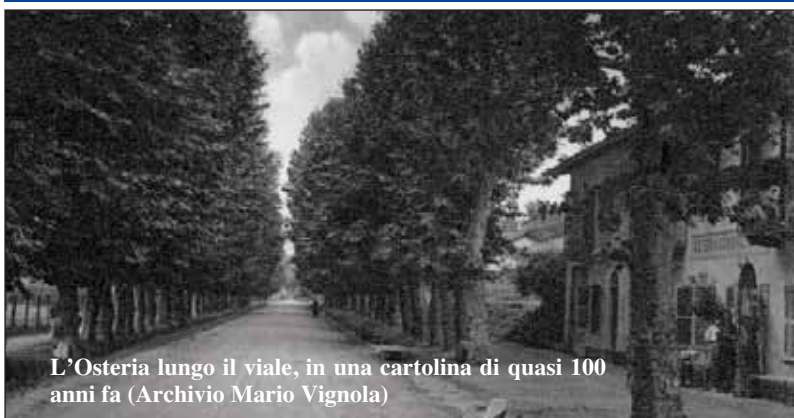
L'Osteria lungo il viale, in una cartolina di quasi 100 anni fa

Alla fine di ottobre hanno chiuso i battenti il ristorante e il "bar di Leo", in piazza Europa. Scompare così un altro locale storico del paese: le foto antiche di una Sommariva Perno inizio '900 testimo-