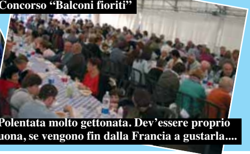
Polentata molto gettonata. Dev'essere proprio buona, se vengono fin dalla Francia a gustarla....