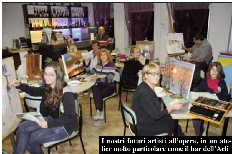
I nostri futuri artisti all'opera, in un atelier molto particolare come il bar dell'Acli