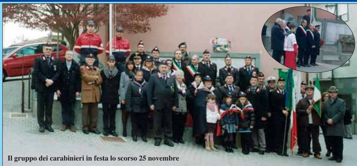
Il gruppo dei carabinieri in festa lo scorso 25 novembre

Domenica 25 novembre i carabinieri di Sommariva Perno hanno festeggiato la "Virgo fidelis", patrona dell'Arma. La festa è iniziata con la S. Messa, nel corso della quale don Gianni ha ringraziato tutti i carabinieri, in servizio ed in congedo, per il prezioso contributo che offrono a favore della comunità sommarivese, con la loro presenza vigile ma discreta. E' proseguita poi davanti al monumento di piazza Marconi dove è stato reso onore a tutti i Caduti, con la deposizione di una corona d'alloro. Il sindaco dott.