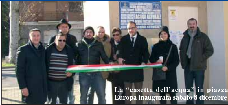
La "casetta dell'acqua" in piazza Europa inaugurata sabato 8 dicembre

Una "casetta per l'acqua" anche a Sommariva Perno. Sorgerà in piazza Europa, nel fabbricato del peso pubblico ampliato appositamente, e a costruirla sarà la ditta PierH2O, che ha partecipato al bando del Comune, offrendo le proposte migliori. L'intervento sarà infatti a costo zero per il Comune. Nella decorazione della casetta saranno coinvolti gli alunni delle scuole: un'idea che renderà più "giovane" l'iniziativa e soprattutto motiverà le nuove generazioni verso un problema di grande attualità come quello del risparmio e della razionalizzazione nell'uso delle risorse idriche.