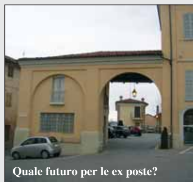
Quale futuro per le ex poste?

ricevimento dei tre medici e dell'assistente sociale dell'ex consorzio Intesa, la cui sede dunque rimarrà invariata. Siamo convinti che con questa nuova disposizione il servizio per i cittadini sarà notevolmente