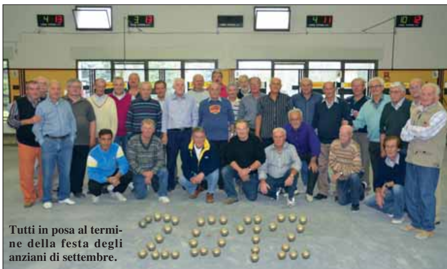
Tutti in posa al termine della festa degli anziani di settembre.

Si è conclusa la stagione della Società Bocciofila con un bilancio nettamente positivo. Molte sono state infatti le manifestazioni, ma la più sentita è stata senza dubbio la gara dei veterani alla quale hanno partecipato moltissime persone. Al