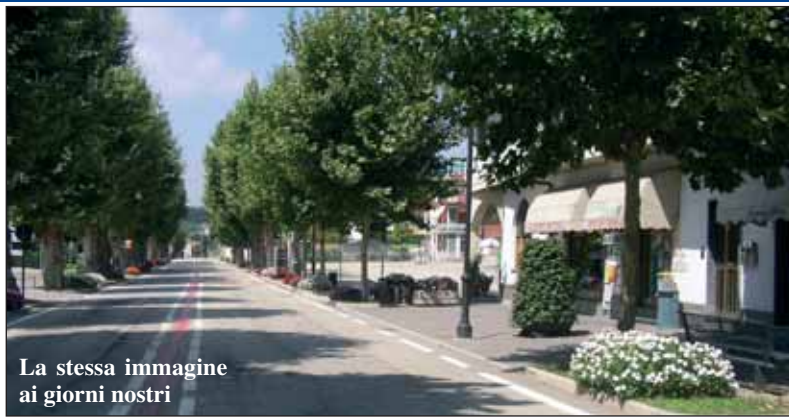
La stessa immagine ai giorni nostri