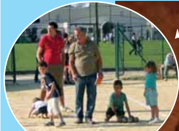
Bocce: una passione senza età