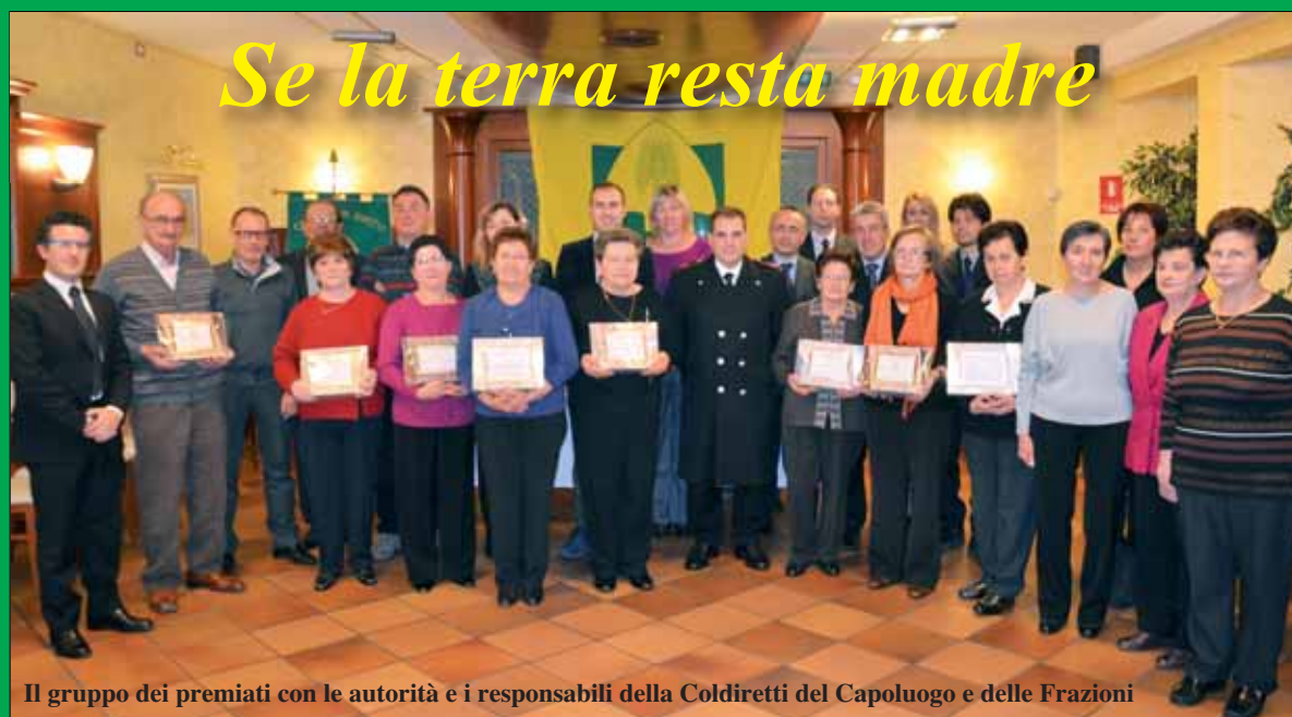
Il gruppo dei premiati con le autorità e i responsabili della Coldiretti del Capoluogo e delle Frazioni

Domenica 18 novembre i coltivatori sommarivesi hanno celebrato la loro tradizionale "Festa del Ringraziamento", l'appuntamento che da 40 anni ormai caratterizza l'autunno sommarivese. Una festa come sempre semplice e bella, che ha avuto un suo primo momento solenne nella S. Messa, con la