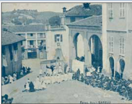
L'angolo delle poste nel 1933 era così

Cambiamenti in vista per gli "storici" locali situati in via Ala, nel centro storico del paese. Fino a novembre di quest'anno, questi spazi sono stati utilizzati regolarmente dai Coltivatori diretti, dalla CISL, dal Gruppo Volontari ed hanno ospitato gli ambulatori delle dottoresse Pelizza e Gramaglia. L'obiettivo dell'amministrazione comunale era quello di trovare (in accordo con le parti interessate) una sistemazione più adatta per le