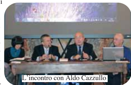
L'incontro con Aldo Cazzullo